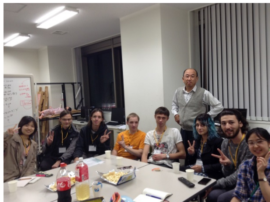
ロシアの仲間と指導の越山先生