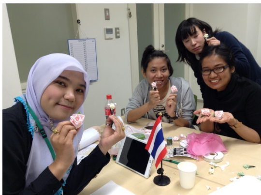
タイの留学生達とリボンフラワー作り

（習志野市消費生活センターは、金融・経営リスク科学科 越山研究室と技術協力提携をしています）